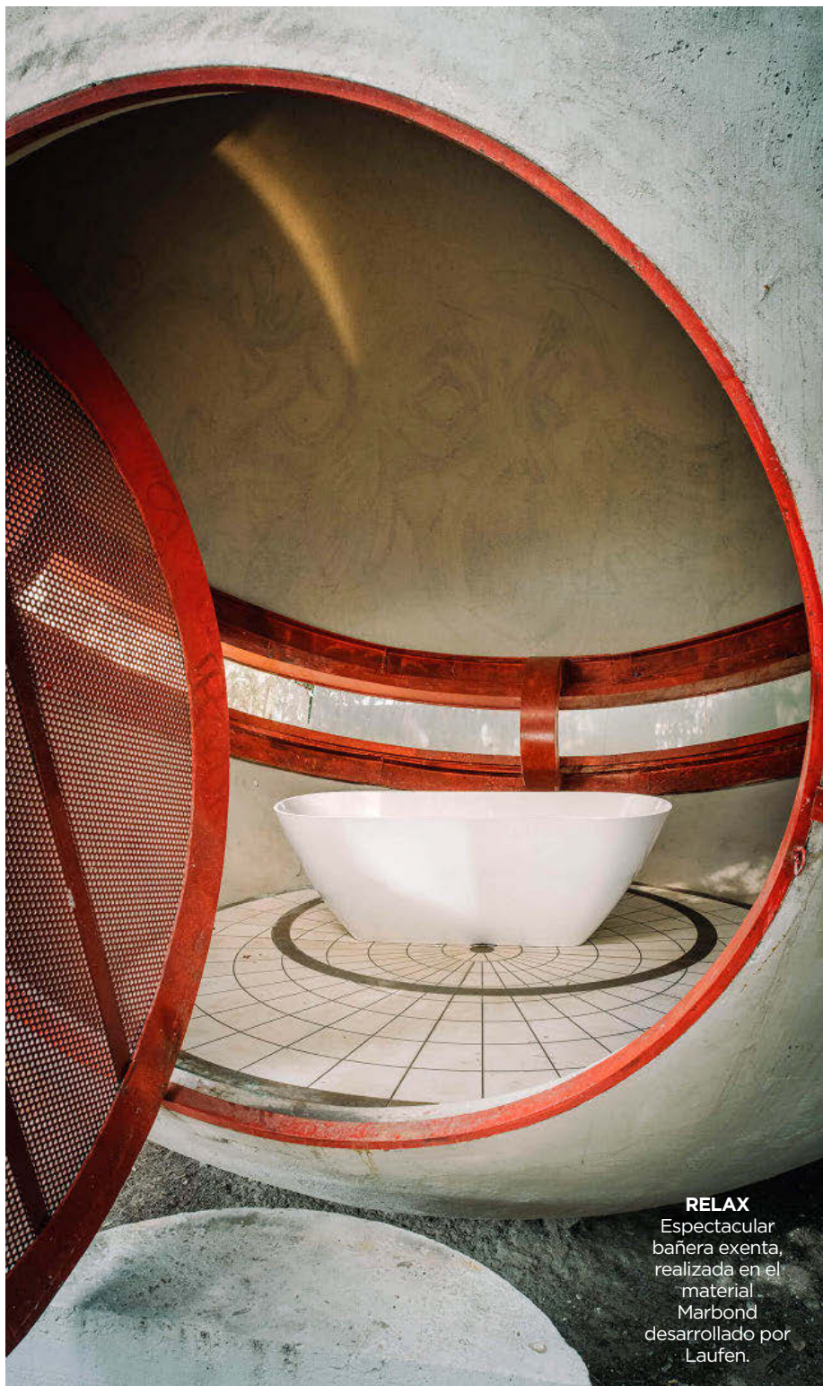
RELAX Espectacular bañera exenta, realizada en el material Marbond desarrollado por Laufen.