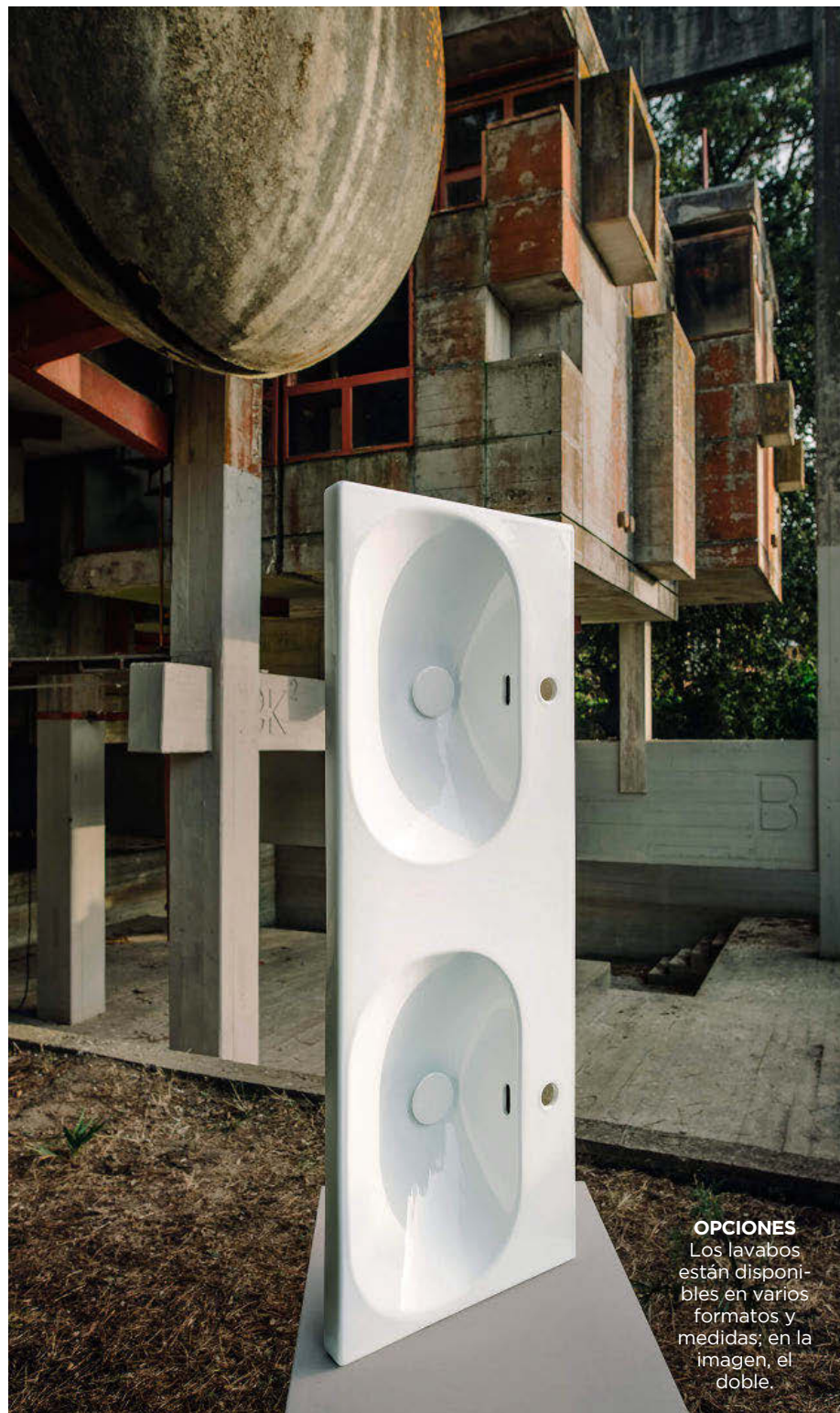
OPCIONES Los lavabos están disponibles en varios formatos y medidas; en la imagen, el doble.

Lua es una familia de sanitarios que combina a la perfección la pureza formal y la mano de obra de alta calidad. Las esquinas suavemente redondeadas y los bordes finos se combinan armoniosamente en las distintas piezas, desde el lavabo (90 euros), al inodoro (desde 155 euros) y las bañeras (desde 2.695 euros la exenta y 1.650 la enclaustrada). “En esta colección la dificultad se me planteó cuando quise hacerla muy normal pero a la vez con el sello propio de la casa, que es una compañía que ofrece calidad y también diseño”, asegura.