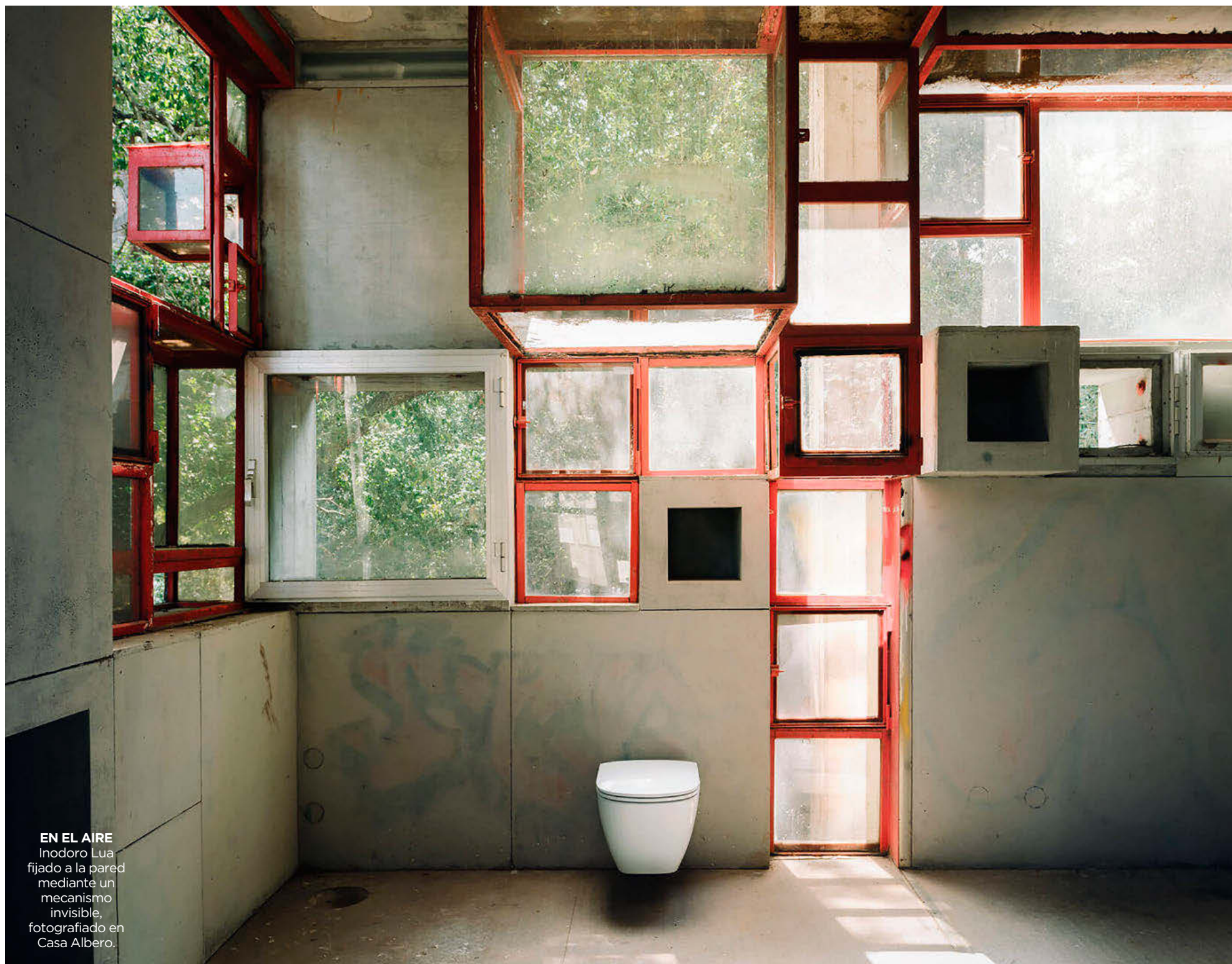
EN EL AIRE Inodoro Lua fijado a la pared mediante un mecanismo invisible, fotografiado en Casa Albero.